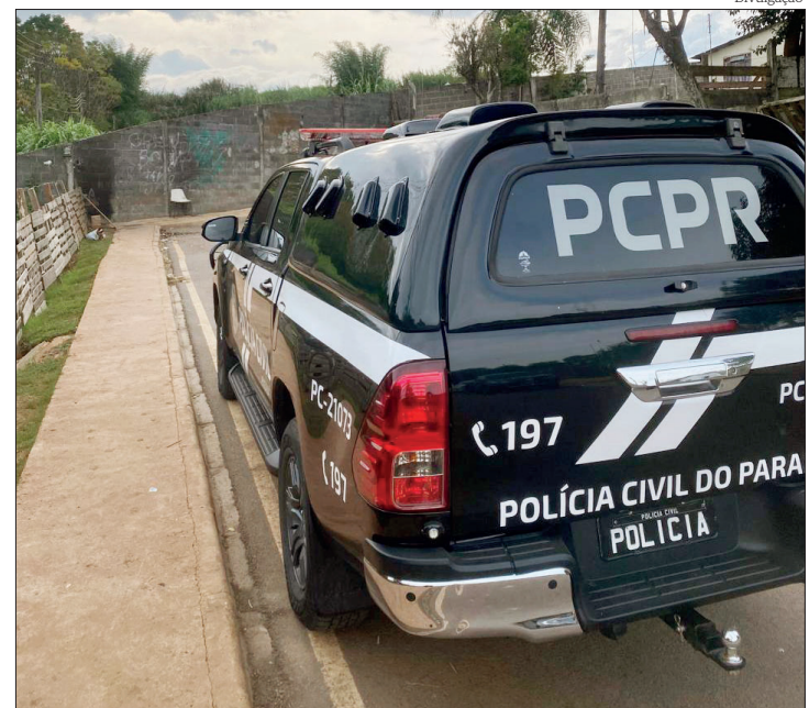
A operação aconteceu nesta quinta-feira (25), sendo que três pessoas foram encaminhadas à delegacia da cidade para esclarecimentos